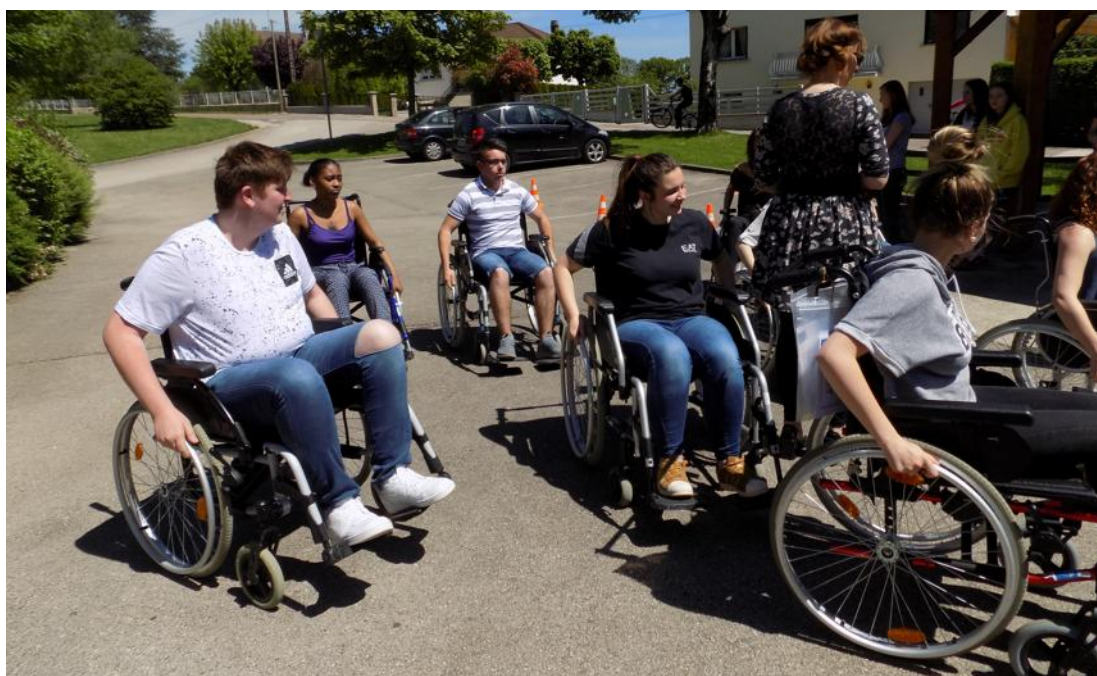
Un parcours en fauteuil roulant pas si évident que cela !

Une immersion proposée dans le cadre des journées handi-citoyennes.